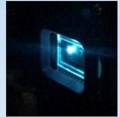
有機半導体レーザー などなど...