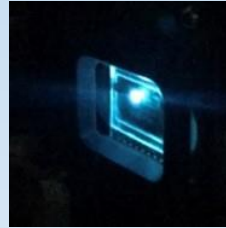
有機半導体レーザー などなど...